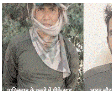
पाकिस्तान के कब्जे में पीके साहू