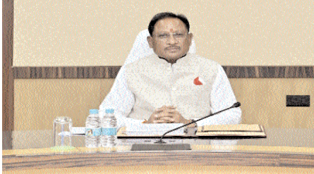
परिपालन में अज कलाकारों को दी जाने वाली मासिक वित्तीय सहायता (पेंशन) को 2000 रुपये से बढ़ाकर 5000 रुपये प्रति माह कर दिया गया है।

राजपुर: मुख्यमंत्री जी विद्या देव साथ की अध्यक्षता में आज यहां मंत्रालय महानदी भवन में आयोजित कैबिनेट की बैठक में अनेक महत्वपूर्ण निर्णय लिए गए। मंत्रिपरिषद ने राष्ट्रीय शिक्षा नीति के तहत बच्चों की शैक्षणिक गुणवत्ता में सुधार के लिए राज्य के शासकीय विद्यालयों में मुख्यमंत्री शिक्षा गुणवत्ता अभियान का संचालन करने का अहम निर्णय लिया गया। इस अभियान के अंतर्गत शिक्षा की गुणवत्ता सुधारने, पाठ्य-शिक्षक सहभागिता बढ़ाने और शैक्षणिक उपलब्धियों को उन्नत करने के लिए कई महत्वपूर्ण विद्युतों को विशेष फोकस किया जाएगा। स्कूल शिक्षा विभाग द्वारा अभियान के संबंध में विस्तृत विद्या-निदेश जारी किया जाएगा। अभियान में आतंकवाद के खिलाफ अभियान के दिनांक 69 वीं वार्षिक स्मारक भारत के क्रांतिकारी स्वामी राम का महत्वपूर्ण चेतना बनाए गए। पिछले साल अक्टूबर में ही उनको बड़े श्रेणी की उन्नत की गई थी, जिसे अब श्रेणी की गई है। अब विदेश भर्ती के कॉफिले में वृद्धि प्रफुल्लित और 22 सूक्ष्म जवाब शामिल होंगे। अभी उनके साथ 12 सीआरपीएफ के सशस्त्र कर्मियों हैं। पिछले साल उनकी सुरक्षा शासितानी आतंकवादियों की धमकियों के बाद बढ़ाई गई थी।