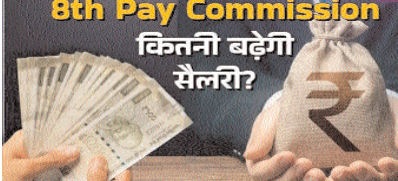
वेतन और पेंशन में अत्यधिक वृद्धि होगी। हालांकि, संभावित विविध जोड़ को देखते हुए, पूर्ण का संकेत है कि सरकार के लिए इस माम को पूरा करना वृत्तीय होगा।

0 देश के कर्मचारियों संघ फिटमेंट फैक्टर पर जोर दे रहे हैं। 0 वे इसे २.८६ पर निर्धारित करने का आग्रह कर रहे हैं। 0 संशोधन से मूल वेतन और पेंशन में उल्लेखनीय वृद्धि होगी। वेतन और पेंशन में अत्यधिक वृद्धि होगी। हालांकि, संभावित विविध जोड़ को देखते हुए, पूर्ण का संकेत है कि सरकार के लिए इस माम को पूरा करना वृत्तीय होगा।