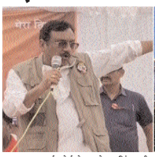
जबलपुर: हाईकोर्ट ने आपरेशन सिंदूर को नायिका कर्नल सोफिया कुरेशी पर अंगलट दिपण्णी के मामले में स्वतः संज्ञान लेकर सुनवाई की।